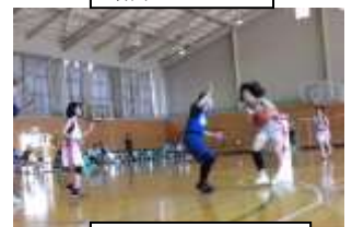
シュートチャンス!