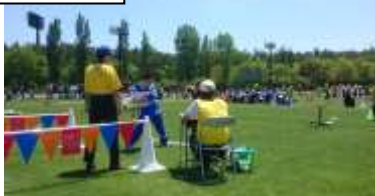
コーチの指示を聞く