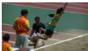
より 遠くへ! ジャンプ