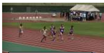
横一線・ラストスパート!