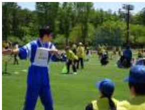
良いフォームです!