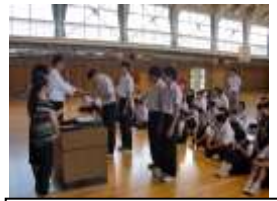
学部集会：表彰の様子

さおり織り製品部門 銅賞 トートバック (自作のトートバックにさおり織りのコサージュをデザイン)