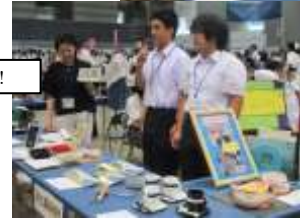
人の前で話しそして伝える、という大切さ