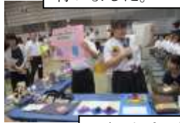
工夫したプレゼン!

手工芸、紙すき、木工、陶芸班の代表者が製品づくりの工程などの状況について、詳しくプレゼンテーションを行いました。