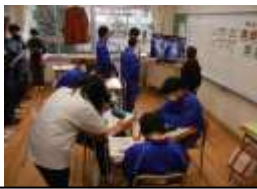
生活単元学習プレゼンテーション