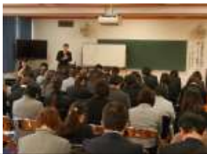
外部講師による授業づくりの教員研修