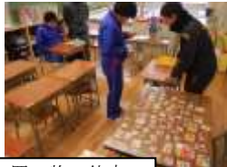
数学 買い物の仕方

谷川俊太郎の「生きる」を題材に、生徒が書いた内容を抜粋。生徒の豊かな感性がうかがえます。