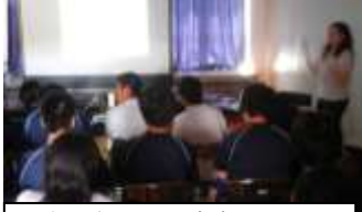
外部講師による歯磨きの講話