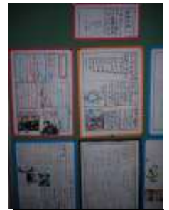
できあがった新聞