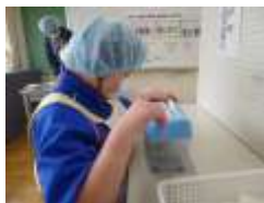
1年生緩衝材づくり