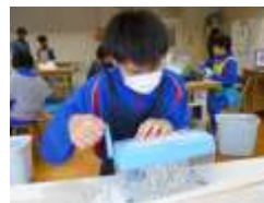
1年生緩衝材づくり