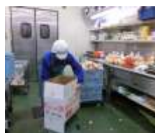
リオンドール飯盛