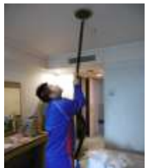
CRSコーポレーション