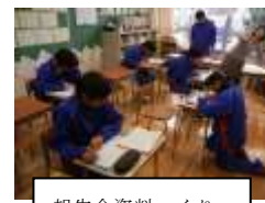
報告会資料づくり

学校に一本の電話が入りました。現場実習へ通勤途中の生徒からです。『道に迷った』とのこと！担任からその場所で待つように指示されました。そして担任が急行！小生も同行しました。現場着・・・。