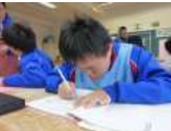
2年生目標の記入・反省