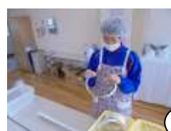
ランドセル緩衝材づくり