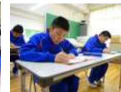
3年生目標・反省の記入