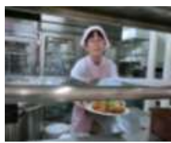
メフォス 大学学食