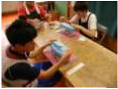
シュレッダー作業