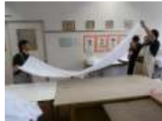
シートを定形に裂く