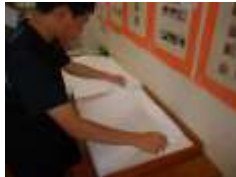
ウエスをまとめて