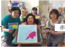
赤べこのイラストを持って

訪問教育担当教員が家庭に出向いて、訪問授業を行いました。教員の専門性を活かした授業では、校外学習で見学した「鶴ヶ城」と「武家屋敷」について学習しました。歴史上の人物について踏み込んだ内容でしたが、真剣な表情で会津の歴史について学習することができました。また、全員で赤べこのイラストを描き鑑賞しあう等、感じた事を伝える学習も深めることができました。