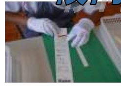
箸袋折り・箸入れの補助具(正確な作業を)