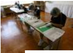
黙々と箸袋折りに取り組む