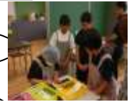
食い入るように観察！

1年生は、先輩たちの実習の様子を見学し、個別の目標達成に向けて取り組む先輩方の姿勢や作業場のピリピリ感などの雰囲気を感じ取りました。見学を通して自分が感じた事柄を次の実習に活かそうと