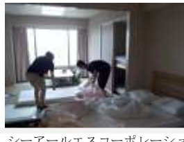
シーアールエスコーポレーション