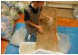
ペットボトルつぶし