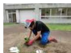
マリーゴールド植え