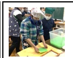
工芸班 紙すき体験