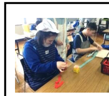
家庭班 布さき体験

1月21日～24日に、小学部6年生13名が中学部体験学習を行いました。クラスごとに音楽、体育、作業学習(家庭班、工芸班)に参加しました。音楽の授業では、日本の音楽に関する学習で、「さくらさくら」の曲に合わせて、太鼓や琴の演奏を行いました。体育では、1～3組はリレーを行い、4・5組はバドミントンを行いました。中学部の先輩の姿をよく見て、演奏したり体を動かしたりする姿が見られました。作業学習の家庭班では、布さきやマット編みを、工芸班では、牛乳パックのラミネートはがしや紙すきをしました。どの活動も初めて行う内容ばかりでしたが、中学部の教師や先輩の話を真剣に聞き、集中して最後まで取り組む姿が見られ、中学部での学習に関心や期待をもつことができた体験となりました。