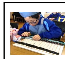
家庭班 マット編み体験