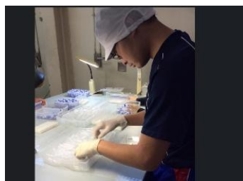
就労継続支援 A 型事業所 株式会社 ワークアイ利通