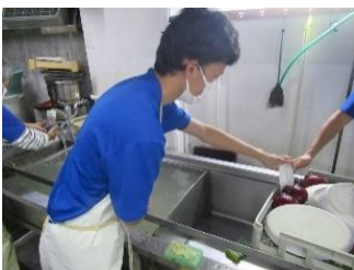
就労継続支援 B 型事業所 特定非営利活動法人ピーターバンネットワーク 共同作業所ピーターバン