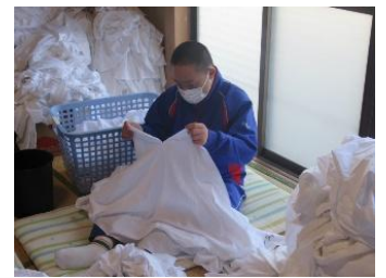
就労継続支援 B 型事業所 NPO 法人市民団体こもれび 障がい者支援事業所フウ