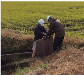
一般企業 堀井建設 株式会社

3学年の生徒は、いよいよ卒業後の進路先決定に向けて、具体的なイメージをもちながら実習に取り組みました。個々の実態や特性への配慮などについて、理解をいただきながら、実践的な実習となりました。