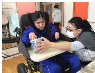
生活介護事業所 特定非営利活動法人 ハッピーロード美里デイサービスセンター