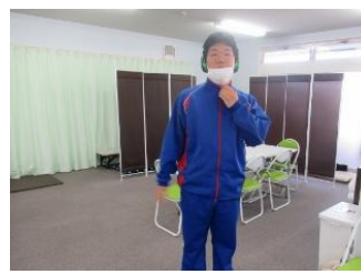
生活介護事業所 ファミリー・生活介護 サービス会津若松